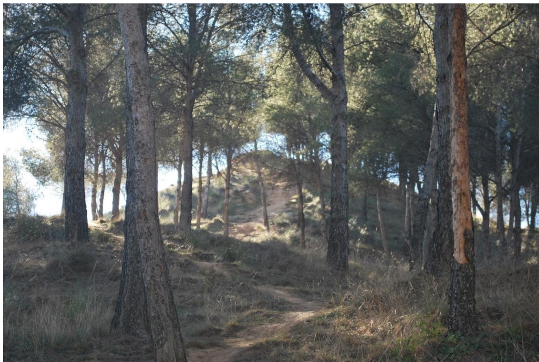
Šumetina na putu do vrha

Znao bi si izdvojiti jedan cijeli dan unutar vikenda za istraživanje tog parka (bio sam u dva navrata, jedanput prije i jedanput poslije lockdowna). Opskrbiš se vodom, bananama i proteinskim keksima u supermarketu, skočiš na bus, i tamo si za 10 minuta!