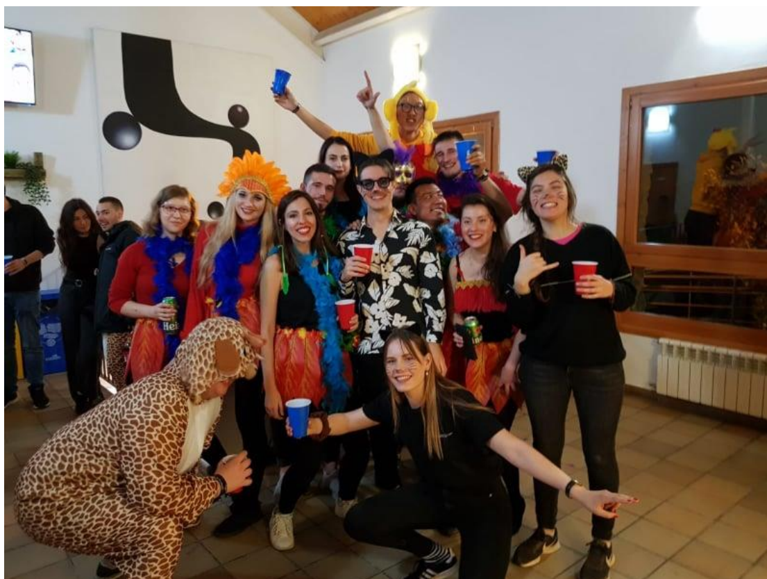
Životinjsko carstvo :)

U nastavku ću ubaciti nekoliko slika da pokušam barme malo dočarati kako je to izgledalo.