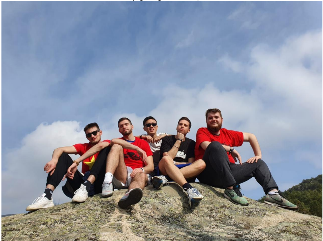
Oporavak od mamurluka