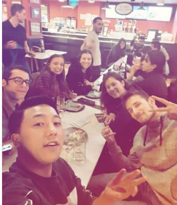
Tapas četvrtak s ekipicom :)

Na kraju je taj aspekt partyja isto sjeo u rutinicu koja se polagano krenula formirati.