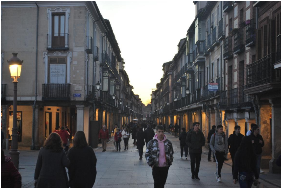
Calle Major, uvijek krcata ljudima