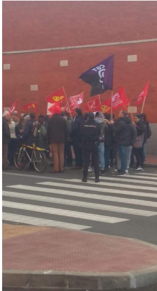
Stariji su dosta aktivni i u demonstracijama

Naravno, ima dijelova koji ne oduševljavaju s arhitekturom, to su rubni dijelovi Alcalé koji više vuku na predgrađa koja sam navikao vidjeti i u Hrvatskoj. No, isto tako je bilo zanimljivo istražiti i tu dimenziju grada. Moram napomenuti da u Alcalí ima dosta beskućnika.