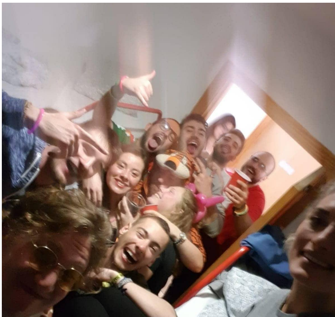
Popunilo nam sobu :)