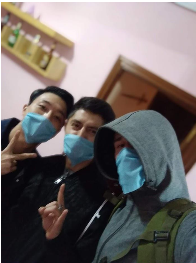
Priprema za izlaz iz stana usred policijskog sata