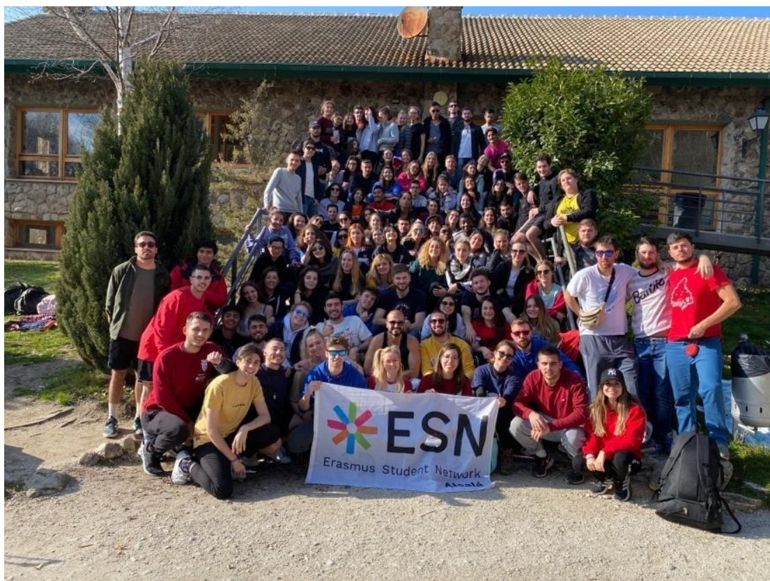
Sve u svemu, izletić za pamćenje :)