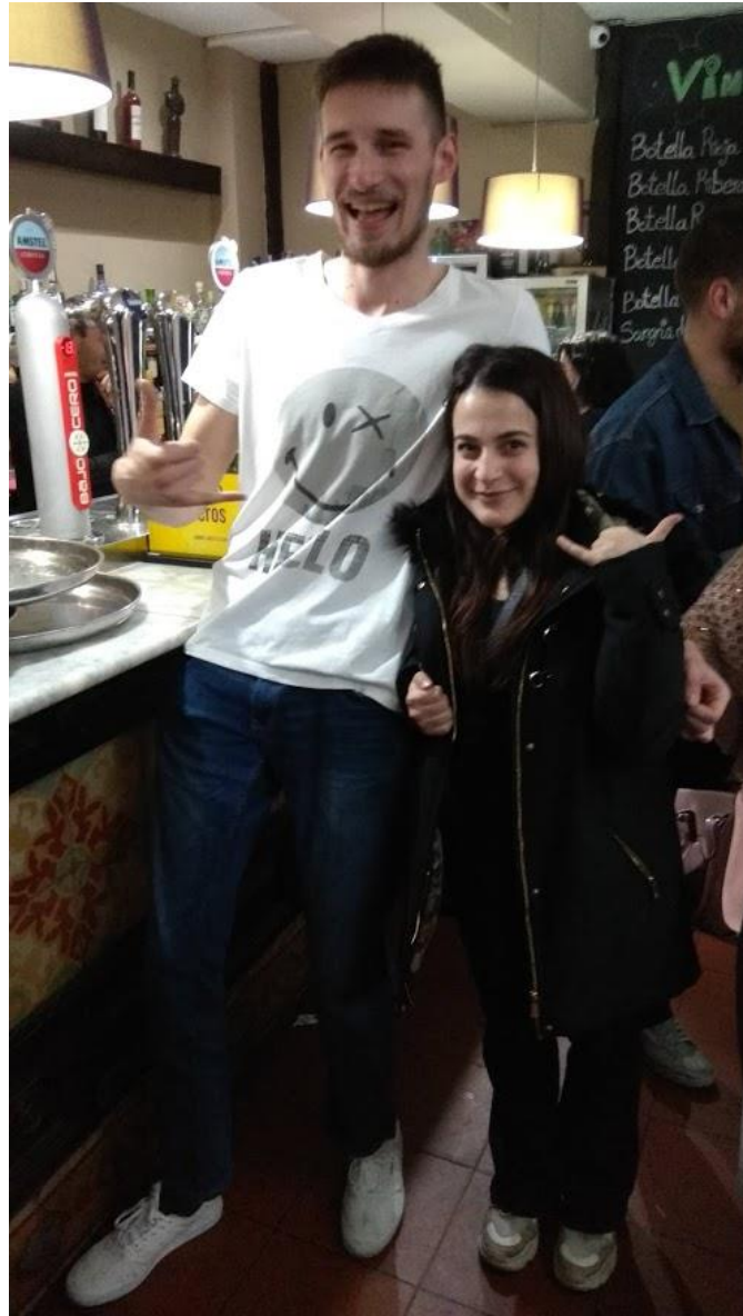
Jedan od mnogih partyja :)

Naravno, preko party scene sam upao u svoju ekipu te smo se naposljetku krenuli nalaziti u kafićima, na trgu, u parkovima, u stanovima - gdje bi onda upoznao još ljudi.