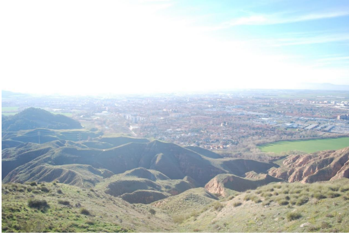
Napokon na pravome vrhu :)

Na putu do višeg brda se prolazi i pored ruševina stare tvrđave i pored pokoja špilja u kanjonima pored. Stvarno predivan ambijent i preporučujem svima koji dolaze u Alcalu na razmjenu da istraže malo i izvan okvira urbane sredine. Ostat ćete ugodno iznenađeni.