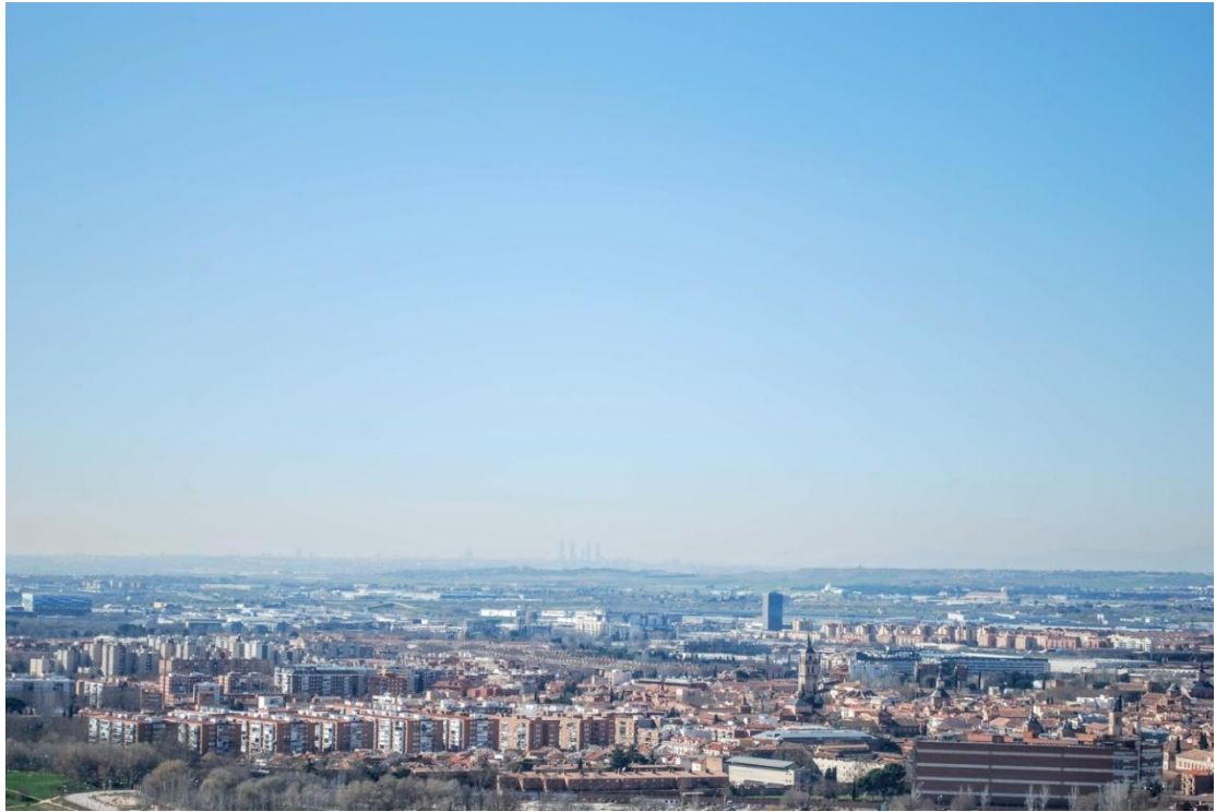
Obris u daljini je Madrid