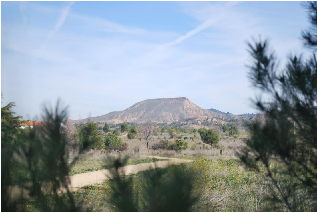
Na putu prema vrhu

Poslije spomenutih dva puta u brda sam se uvelike zainteresirao u istraživanje regije oko Madrida, prvenstveno planinarskih ruta. Nakon kratkog istraživanja sam saznao da se tik pol sata hoda od Alcale nalazi park prirode zvan Los Cerros (prijevod: brda).