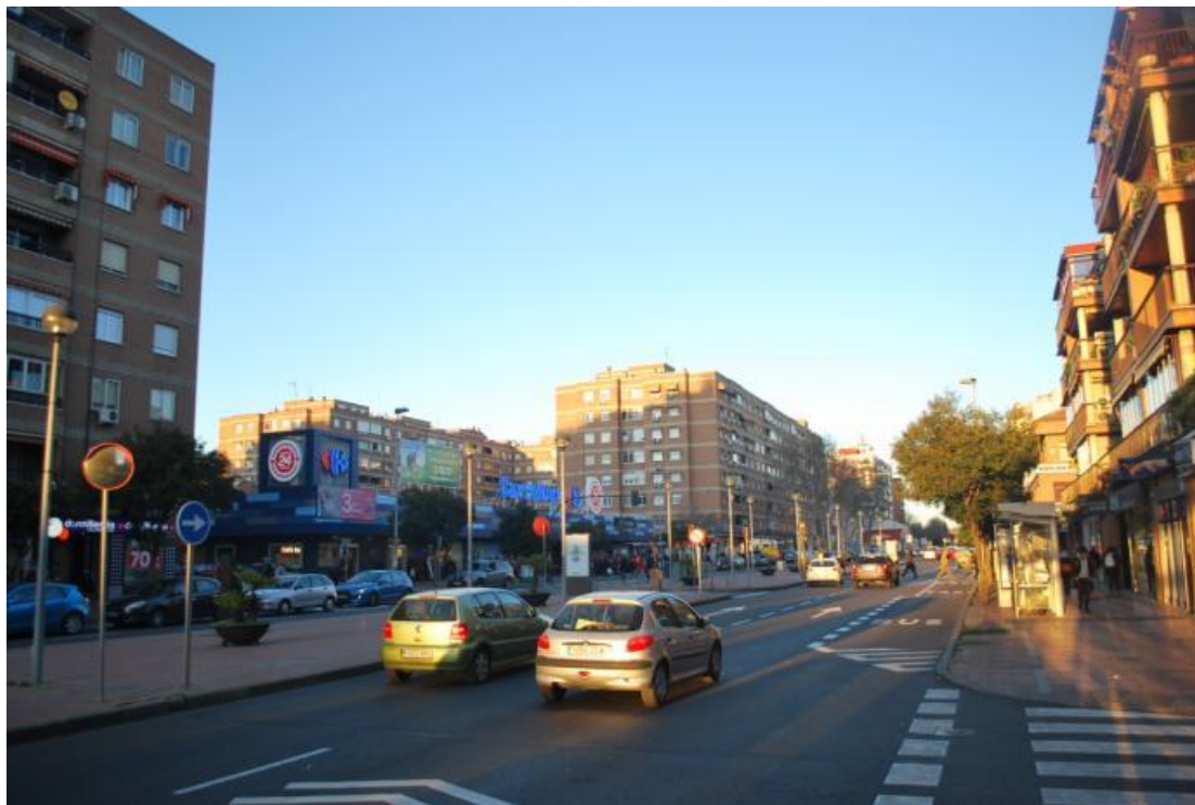
Doslovno prvi prizor koji sam vidio prilikom izlaska iz busa, ujedno i moj kvart

Kako sam izašao iz busa tako sam i shvatio da ovdje lokalna populacija i ne priča pretjerano engleski, tako da mi je odmah u glavi bio cilj naučiti i nešto španjolskoga kako bi se mogao sporazumjeti i na lokalnoj razini.