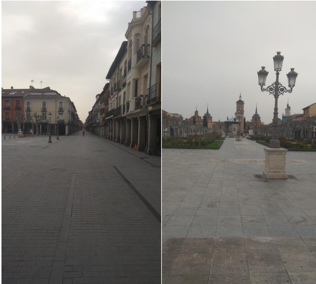
Glavna ulica i glavni trg u staroj gradskoj jezgri potpuno prazni.

No, to ne znači da su druženja bila zabranjena! Često sam se nalazio sa svojom ekipom u stanu na drugom kraju grada, te sam u jednom navratu upao u policijsku patrolu koja me pokušala udaljiti nazad kući. Za dodatnu dozu uvjerljivosti bi uvijek nešto kupio u dućanu kako bih imao izgovor da idem kući, a zapravo se idem naći s frendovima do stana.