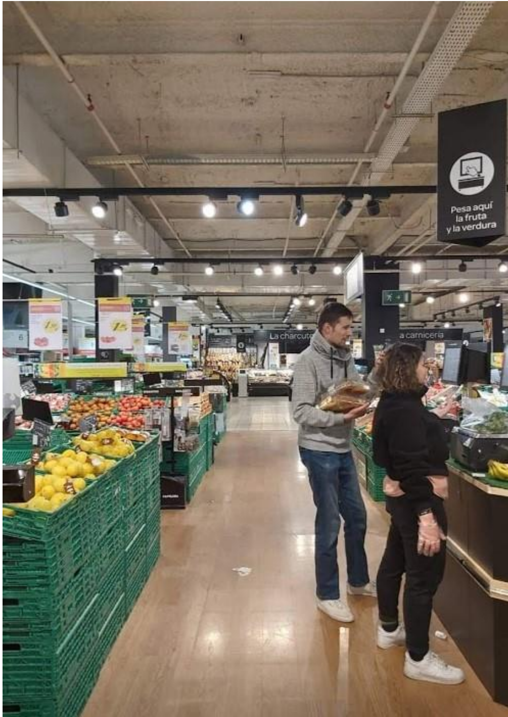
U Carrefouru možeš šoping odraditi i u 4 ujutro :)

Jedna zanimljiva stvar što se tiče Carrefoura je ta što radi od 0-24 i alkohol se prestaje prodavati poslije 10 navečer. Doslovno stave žutu traku u taj odsjek pa se snađi.