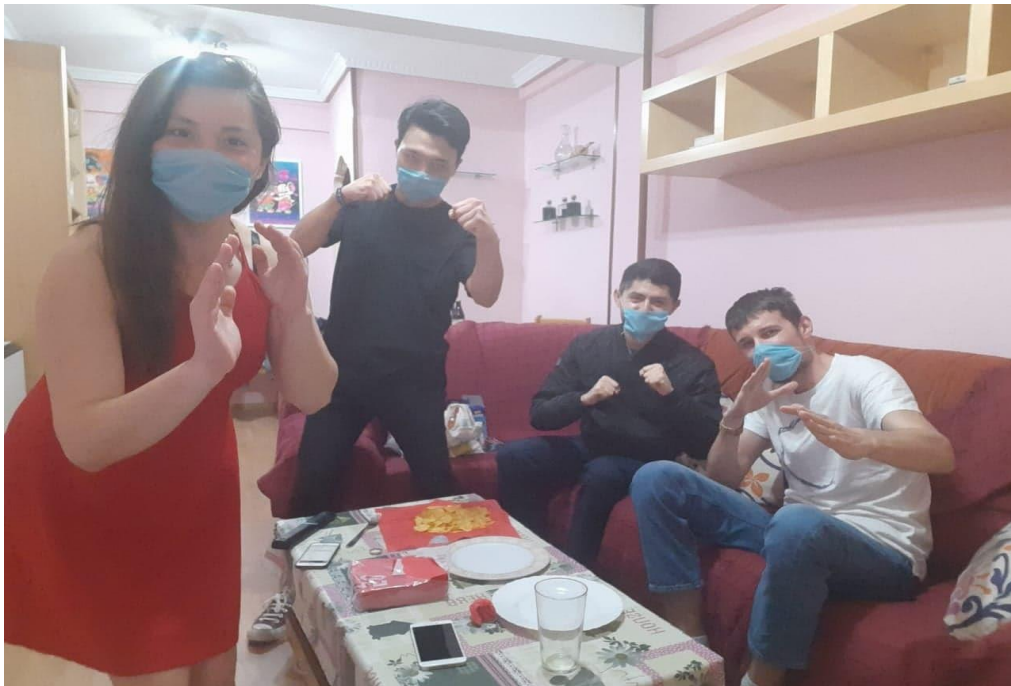
Jedno od posljednjih druženja u Alcali