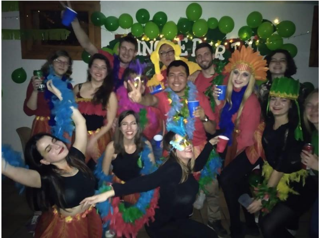
Papige lagano lete :)