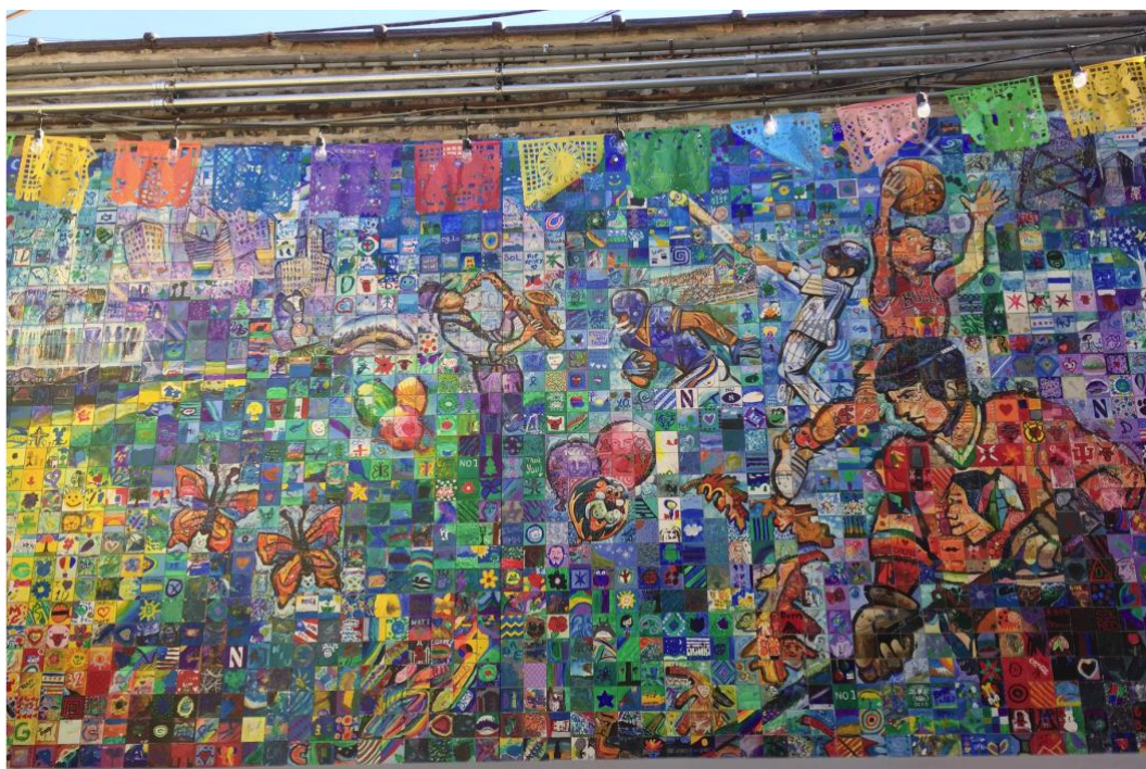
Dan 11. DePaul University 13.09.2018.

Nakon doručka krenuli smo prema DePaul University. Tamo smo imali maleni uvod u međunarodnu suradnju između raznih sveučilišta, a zatim i panel raspravu u kojoj su vodeći ljudi sa našeg i partnerskih sveučilišta raspravljali o prednostima i pozitivnim efektima na studente koji su doživjeli neki od oblika međunarodne razmjene. Isto tako, ja sam održao prezentaciju svog ranije spomenutog istraživanja ali s naglaskom na međunarodnu razmjenu s ciljem da zainteresiram studente DePaul-a da dođu u Hrvatsku. Ostatak dana proveli smo u istraživanju Chicaga.