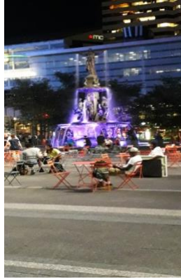
Slika 2. Fontana na trgu u Cincinnatiu