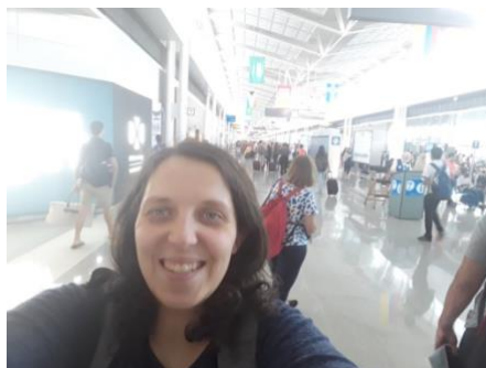
Slika 1. Zračna luka u Dullesu

U ranim jutarnjim satima krenuli smo iz zračne luke Franje Tuđmana u Zagrebu prema zračnoj luci u Frankfurtu na kojeg smo stigli u zakazano vrijeme. Prilikom check-in u Frankfurtu krenula je moja avantura i stjecanje novih iskustava. Kada nam je gospodin na šalteru u Zagrebu printao karte, sustav je slučajnim odabirom odabrao baš mene za sigurnosno pregledavanje na aerodromu. Tada sam prvi put doživjela ono što sam nekoliko puta gledala samo na televiziju u serijama o zaštiti granice. Sve je naravno prošlo dobro i nastavili smo put prema Dulles-u u Washingtonu te kada smo stigli u Dulles dobili smo obavijest da su nam otkazali let prema Cincinnatiu. Tako da smo proveli ovu noć u hotelu u Dullesu.