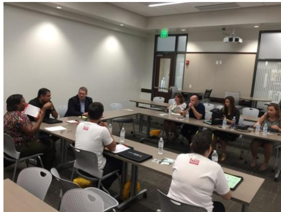
Slika 8. Rasprava o mogućoj suradnji

Danas na red su došli sastanci o mogućim budućim suradnjama i zajedničkim projektima. Upoznali su nas kako kod njih funkcioniraju interdisciplinarni studiji, ljetne škole te međunarodna suradnja. Otvorile su se različite zanimljive diskusije i ideje oko mogućih studentskih razmjena i sudjelovanja na ljetnim školama. Nakon svih sastanaka krenuli smo u obilazak Sveučilišta. Između ostalog smo posjetili i zgradu studentske zajednice gdje smo vidjeli njihove prostorije za osmišljavanje, realiziranje svojih poduzetničkih ideja.