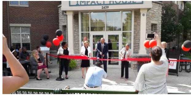
Slika 4. Rezanje vrpce tijekom otvorenja novih ureda McNair programa

projektima. I na kraju dana smo posjetili Taft Museum of Art gdje smo između ostalog pogledali izložbu fotografija Ansel Adamsa.