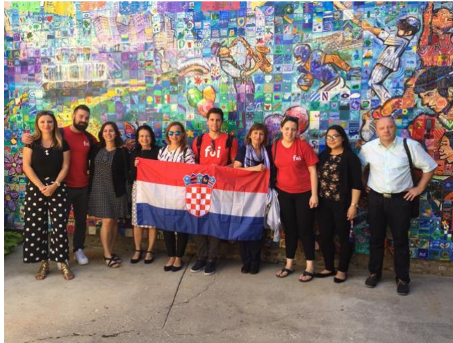
Slika 10. Zajednička fotografija u prostorijama El Valora

umjetničkih djela po zgradama. Obilazak smo završili u zgradama Sveučilišta gdje nas je dočeka profesor iz Odjela za osobe s invaliditetom i ljudskog razvoja. Zajedno s njim smo poslušali prezentaciju o tome kako i gdje se mogu obratiti osobe s invaliditetom za pomoć te nas je na kraju predavanja odveo do radionica gdje se razvijaju nove ideje i pomagala za osobe s invaliditetom. Dan smo završili s obilaskom i kulturnim upoznavanjem s centrom Chicaga te posjetom Millennium parku.