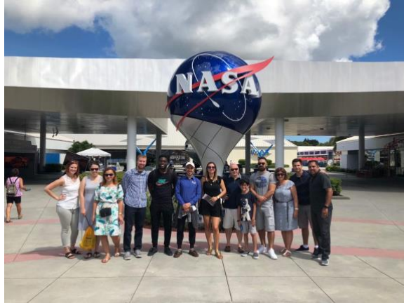
Slika 7. Kennedy Space Center