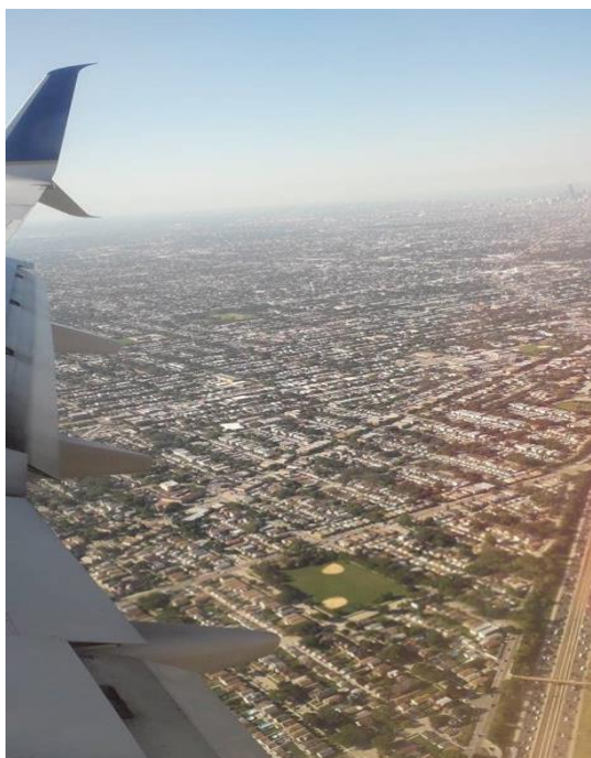
Slika 9. Pogled na Chichago iz aviona

Jutarnje sate smo proveli u zadnjim pripremama za odlazak u Chichago. Oko podneva smo krenuli svi zajedno prema zračnoj luci u Orlandu gdje smo čekali avion za Chichago. Let je trajao kratko, ali naš put do hotela je trajao dosta dugo. Chichago je veliki grad s jako puno auta i velikim gužvama u prometu. U hotelu nas je dočekala asistentica direktora McNair programa na Sveučilištu DePaul. Nakon što smo se smjestili u hotel otišli smo na večeru s direktorom MCNair programa DePaul i njegovom asistenticom.