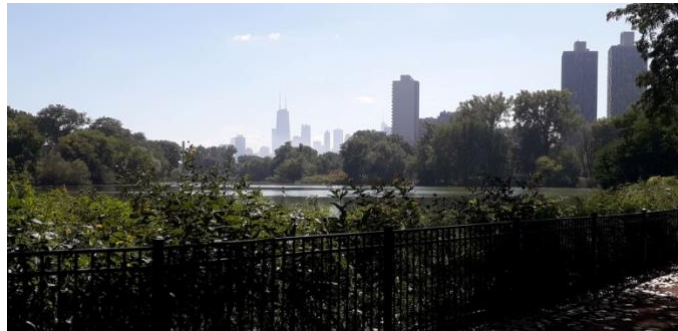
Slika 14. Jezero u Lincoln Parku

priče želim zahvaliti svima koji su se potrudili i omogućili mojim kolegama i meni da sudjelujemo u ovoj Međunarodnoj razmjeni studenata te time omogućili mi razvijanje novih vještina i poznanstva.