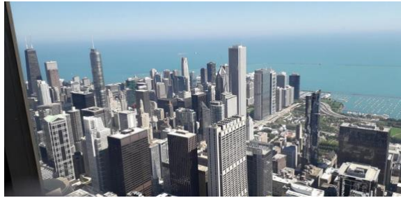
Slika 12. Pogled na Chicigo iz Wills Towera

Dan nam je započeo, a i završio s razgledavanjem kulturnih znamenitosti grada Chicaga. Prvo smo posjetili Navy Pier te se vozili u kotaču iz kojeg smo imali prekrasan pogled na jezero Michigan i na dio grada Chicaga. Nakon toga smo obišli najvišu zgradu Wills Towera u Chicagu koja se sastoji od 108 katova, a visoka je 443 metra. Nakon kratke popodnevno odmora posjetili smo arenu koja je dom Chicago Bullsa i Chicago Blackhawksa. Tu se odigravaju NBA i NHL utakmice. Vidjeli smo kip košarkaša Michaela Jordana i dres našeg košarkaša Tonia Kukoča.