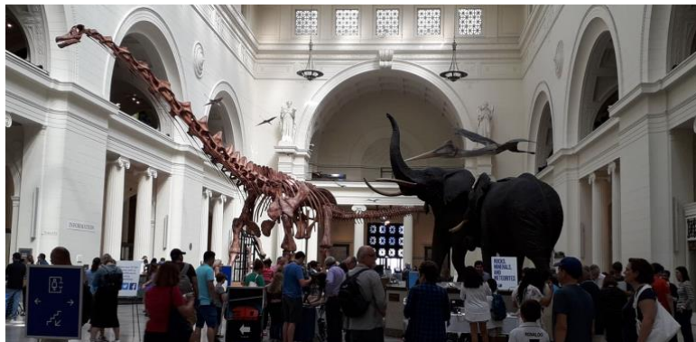
Slika 13. Predvorje muzeja The Field Museum

Subota je bila rezervirana za posjet muzeju The Field Museum. U muzeju smo mogli proći kroz cijelu prošlost i razvitak zemlje. U muzeju je bila postavljena glavna izložba te par dodatnih izložbi. Od dodatnih izložba sam odabrala pogledati mumije. Osim muzeja današnja aktivnost je bila i pisanje svojih zapažanja i događaja na ovom putu.