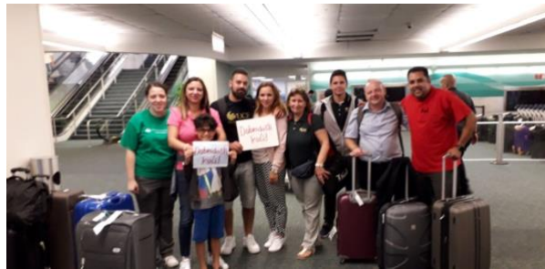
Slika 6. "Dobrodošli kući"