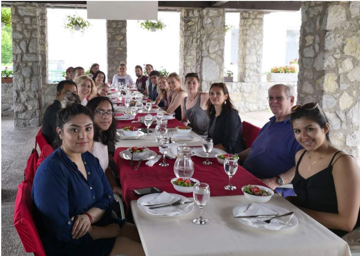
još malo fotki. Svi smo bili oduševljeni ljepotom Trakošćanskog dvorca.