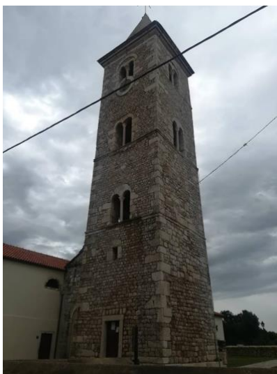
Slika 1. Crkva sv. Anselma

U petak, 22.06.2018. posjetili smo grad Nin. Nin je povijesni grad te se nalazi na istočnoj obali Jadrana. Zbog kiše koja je padala vrlo kasno smo krenuli u razgledavanje. Prvo što smo mogli vidjeti su gradski bedemi i obrambene kule koje su služile za obranu od napadača. Sve su to ostaci kasno-venecijanskog obrambenog graditeljstva. Nakon što smo ušli kroz glavni ulaz vidjeli smo popločene ulice i stare kuće. Razgledavajući dalje, naišli smo na crkvu sv. Anselma u čijem sklopu se nalazi mala riznica crkvene umjetnosti s izloženim predmetima vrijednog zlatarskog umijeća.