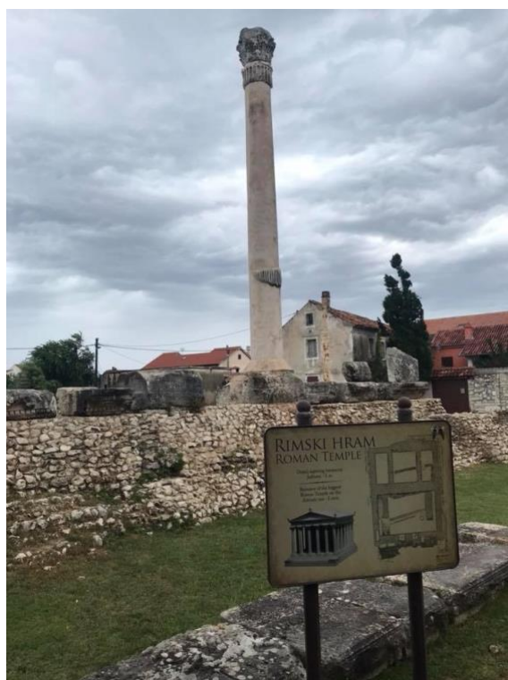
Slika 3. Ostaci rimskog hrama i korintski stup

Sljedeća povijesna destinacija je bila Crkva sv. Križa koja je prozvana najmanjom katedralom na svijetu. Crkva je jedan od simbola grada Nina te je jedini sakralni objekt koji nije dirnut od izgradnje pa sve do danas. Vidjeli smo također i ostatke Rimskog hrama koji se nalazi u samom središtu Nina. Ostaci datiraju iz vremena vladavine cara Vespazijana i njegovo se ime nalazi na natpisu uklesanom na frizu s pročelja hrama. U sklopu ostataka hrama nalazi se i korintski stup originalne visine 17 metara. Nakon cjelovitarnjeg razgledavanja Nina, otišli smo na ručak, a popodne smo imali slobodno za razgledavanje grada Zadra i kupanje.