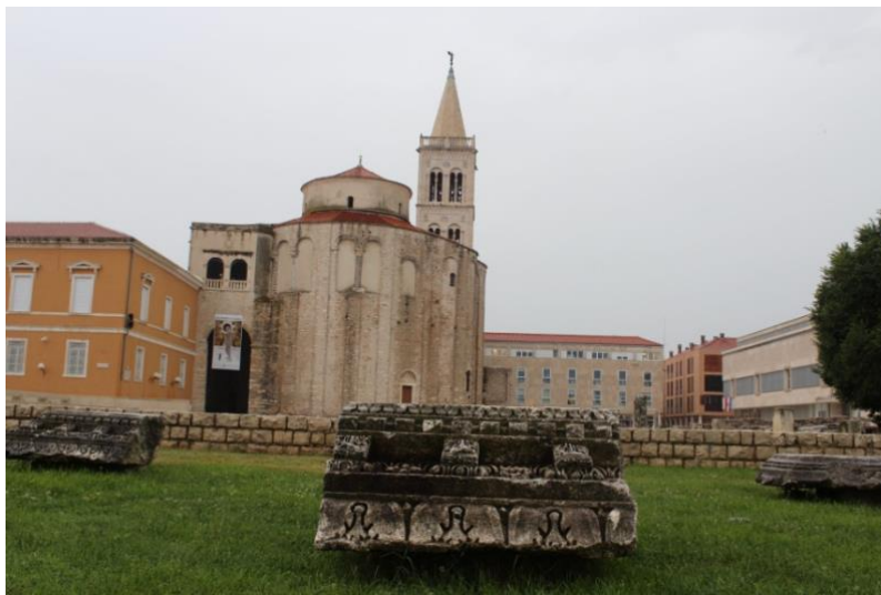
Slika 4. Dio Foruma i Crkva sv. Donata

Petak popodne smo iskoristili za samostalno razgledavanje grada Zadra i kupanje. Većina studenata je otišlo na kupanje, dok profesori su razgledavali grad Zadar. U subotu smo malo duže spavali da se odmorimo od putovanja i razgledavanja. Jutro i veći dio popodneva smo opet imali slobodno te smo to vrijeme iskoristili za razgledavanje znamenitosti. Prvo smo posjetili crkvu sv. Donata koja je simbol grada Zadra. Prema predaji sagradio ju je zadarski biskup sv. Donat u 9. stoljeću. U Crkvi se već godinama održavaju glazbene priredbe poznatog međunarodnog festivala srednjovjekovne i renesansne glazbe.