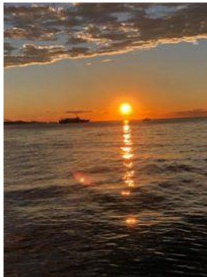
Slika 7. Zalazak sunca, prvi dio