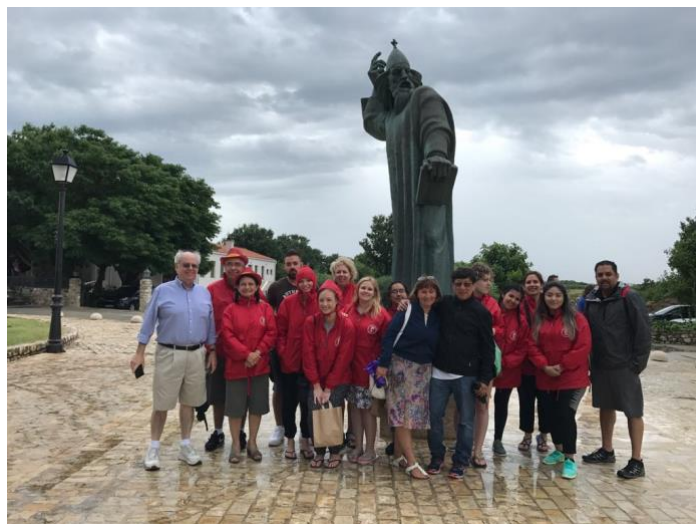
Slika 2. Zajednička fotografija ispred kipa Grgura Ninskog

Sljedeća povijesna destinacija je bila Crkva sv. Križa koja je prozvana najmanjom katedralom na svijetu. Crkva je jedan od simbola grada Nina te je jedini sakralni objekt koji nije dirnut od izgradnje pa sve do danas. Vidjeli smo također i ostatke Rimskog hrama koji se nalazi u samom središtu Nina. Ostaci datiraju iz vremena vladavine cara Vespazijana i njegovo se ime nalazi na natpisu uklesanom na frizu s pročelja hrama. U sklopu ostataka hrama nalazi se i korintski stup originalne visine 17 metara. Nakon cjelovitarnjeg razgledavanja Nina, otišli smo na ručak, a popodne smo imali slobodno za razgledavanje grada Zadra i kupanje.