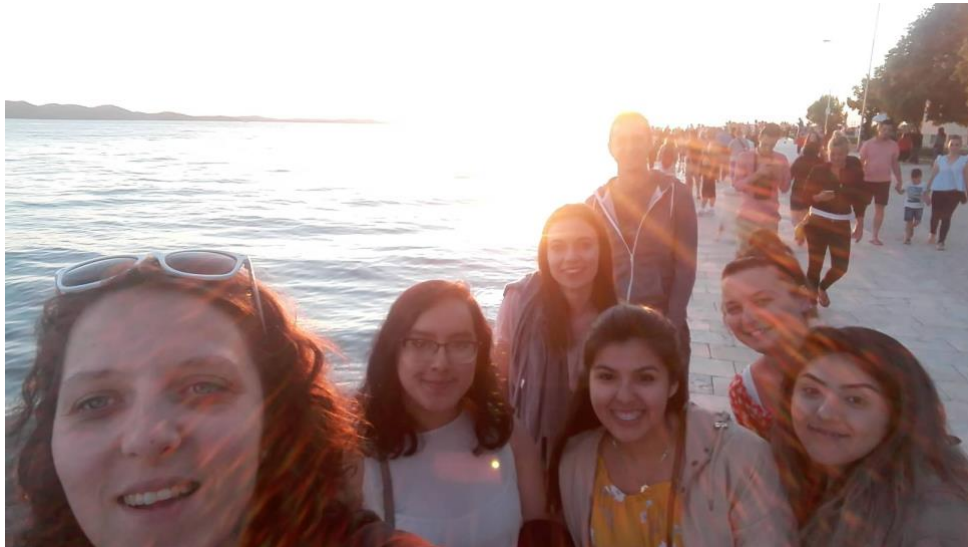
Slika 6. Pozdrav suncu, drugi dio